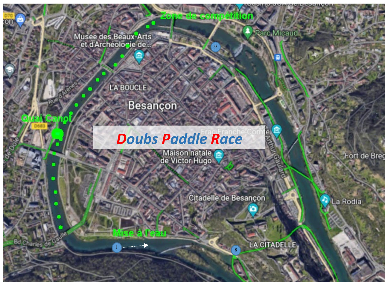
Fig 2 : Détails du parcours de la Doubs Paddle Race Short Distance CD (3 km) / Long Distance LD (9 km)

Départ en ligne pointillée, descente directe vers bouée 1