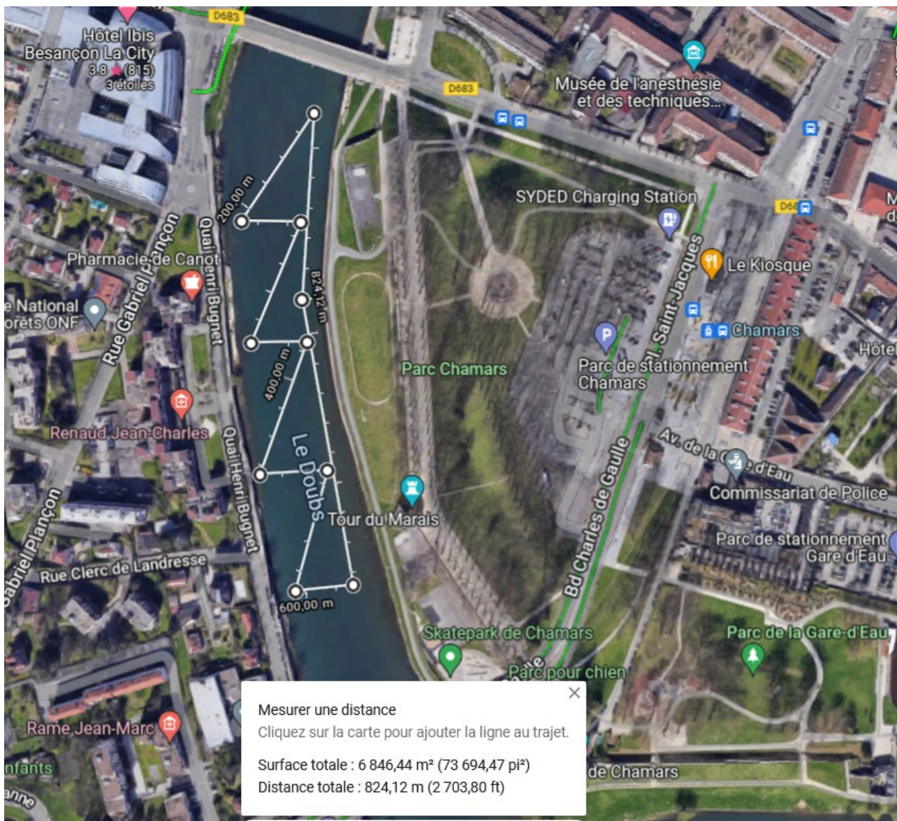
Fig 3 : Détails du parcours de la Doubs Paddle Race Slalom de type Technical Race TR (2.5 km)

Départ en ligne, Montée directe vers bouée 1, puis slalom en descendant, remontée, 3 tours :