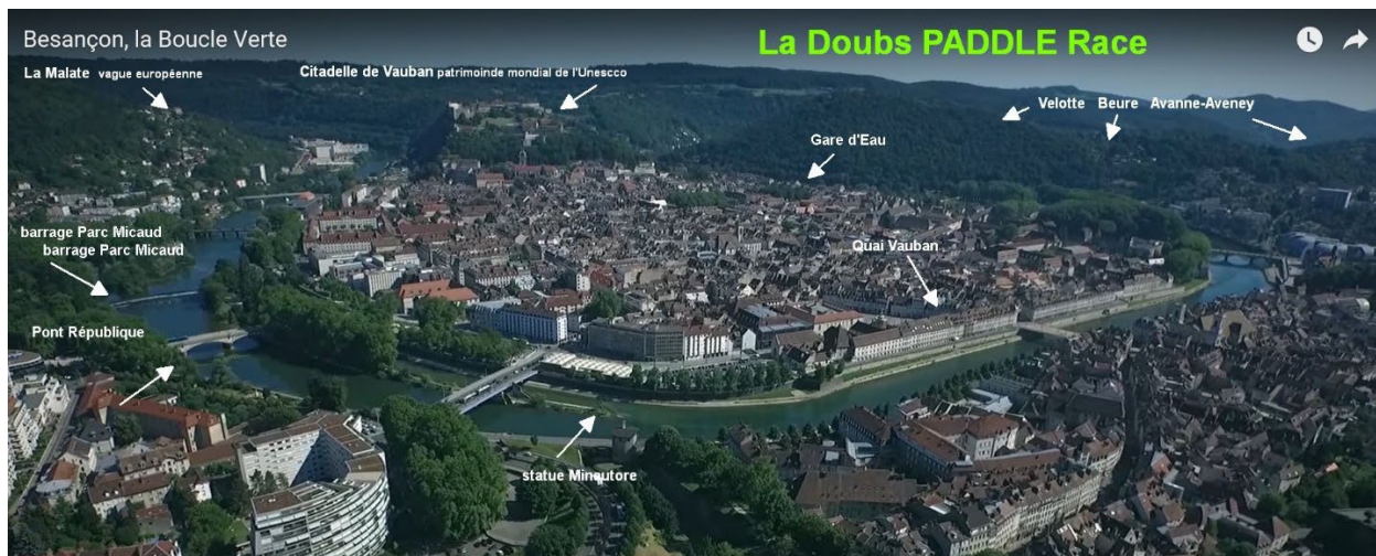
Figure 1 : Localisation cœur de ville de la Doubs Paddle Race

Voir ANNEXE 1 pour le détail des bouées et parcours supposés.